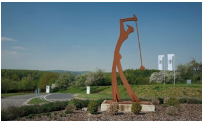
Verkehrskreis am Golfplatz Lobenfeld.

Golf- und Landclub Hohenhardter Hof www.golf-hohenhardt.de 18-Loch-Anlage auf einem ehemaligen Rittergut mit Höhen-unterschieden bis zu 60 m.