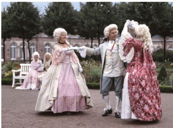
Der „Churfürstliche Hofstaat“ nimmt sein Publikum im Schwetzingen Schloss mit auf eine Zeitreise.

Den Kriegsjahren folgte ein Jahrhundert von zweifelhafter Blüte. Verschwenderische Kurfürsten gaben Unsummen für Lustschlösser, Prachtbauten und Prunkjagden aus. Zwar waren Kunst und Wissenschaft in einem nie gekannten Ausmaß gefördert worden, das Volk aber war so bettelarm, dass es in Scharen auswanderte. Das Bestehen der Kurpfalz fand mit dem kometenhaften Aufstieg Napoleons ein abruptes Ende.