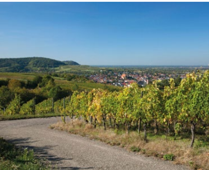
Die sanfte Hügellandschaft des Kraichgaus lässt sich gut mit dem „Drahtesel“ erkunden.

Ein Muss nicht nur für Kraichgau-Touristen ist übrigens ein Besuch des Technik Museums Sinsheim, das mit dem Erwerb der Überschallflugzeuge Concorde und Tupolew und deren Transport nach Sinsheim bereits weltweit für Schlagzeilen sorgte.