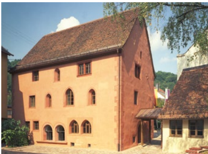
Die „Hühnerfautei“ in Schöнау ist der wohl älteste Profanbau in Baden-Württemberg.