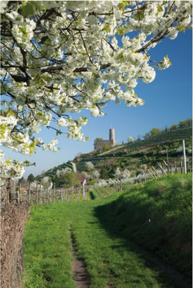
Blick auf die Strahlenburg in Schriesheim.

Viele Wanderwege verbinden die mittelalterlichen Burgen