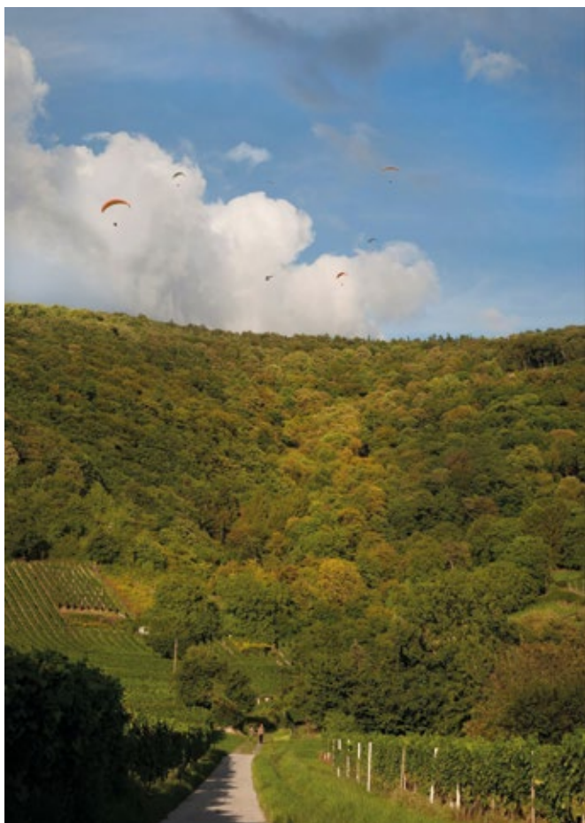
Gleitschirmflieger bei Schriesheim.

Besonders Wagemutige kommen bei einem Tandem-Fallschirm-