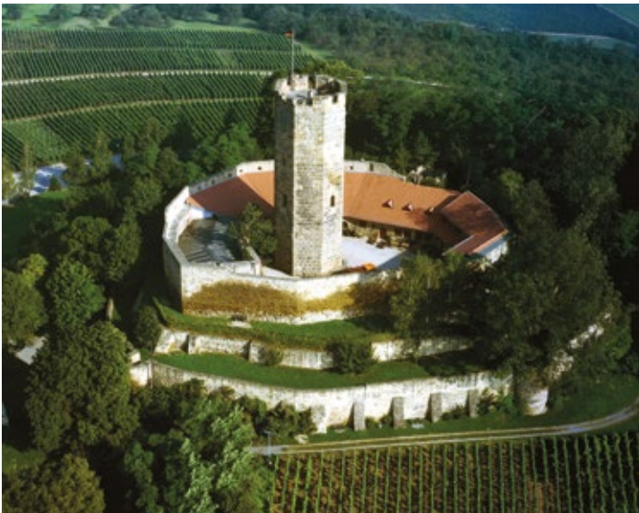
Die Burg Steinsberg in Sinsheim-Weiler bietet mit ihrem einzigartigen achteckigen Bergfried einen Rundblick über den Kraichgau.

Die Karte ist über freizeit@rhein- neckar-kreis.de erhältlich.