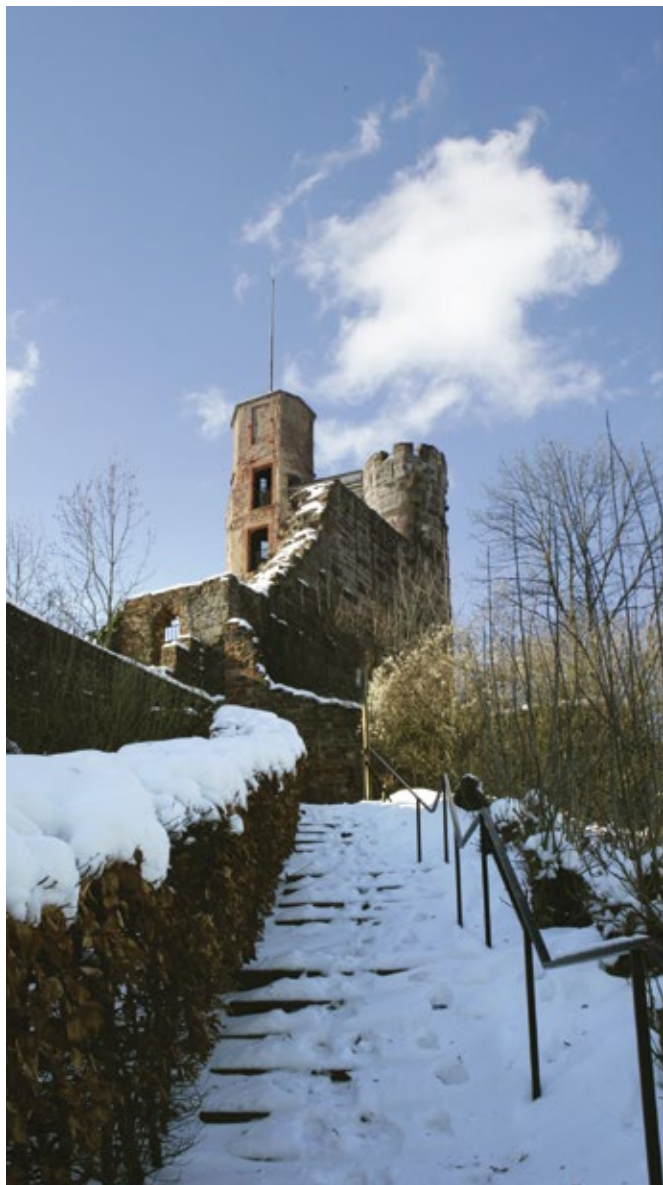
Die Burgfeste auf dem Dilsberg bei Neckargemünd.