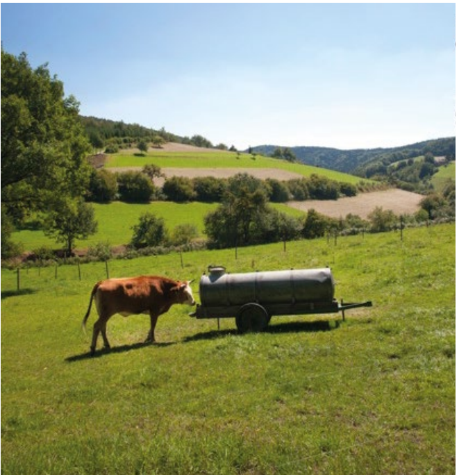
Ländliche Idylle im Odenwald.

Der Odenwald ist Teil des Naturparks Neckartal-Odenwald, der auf gut markierten Wander- und Radwanderwegen zur Erholung einlädt. Er bietet aber auch viele Wald- und Naturlehrpfade. Ein Muss ist das Naturpark-Informationszentrum in Eberbach.