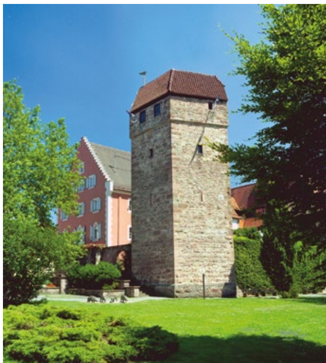
Der Pulverturm aus dem 13. Jahrhundert ist Teil der mittelalterlichen Stadtmauer von Eberbach.

„Villa Rustica“ (Überreste eines römischen Landgutes im Gewann Maueräcker)