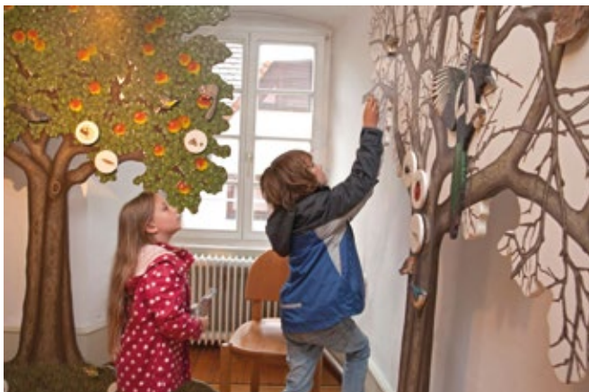
Natur erleben im Naturpark-Besucherzentrum in Eberbach.