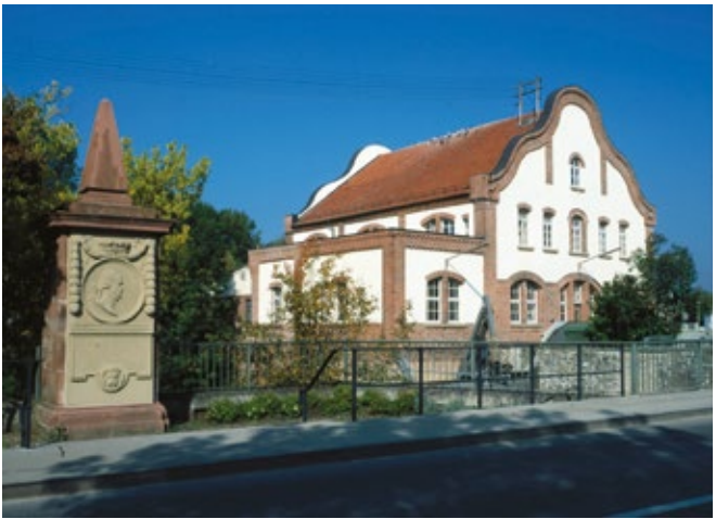
1782 wurde in Meckesheim das Denkmal zur Erinnerung an den Kurfürsten Karl Theodor errichtet.