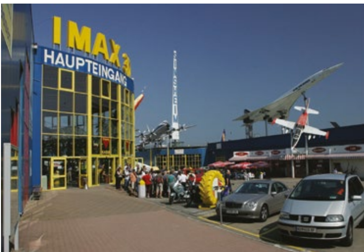
Das Technik Museum in Sinsheim.

Ein weiteres Highlight der Region ist die Klima Arena in Sinsheim - ein innovativer Erlebnisort zum Klimawandel und erneuerbaren Energien. Die multimediale Ausstellung und ein großzügiger gestalteter Themenpark laden dazu ein, sich mit den Themen Klimaschutz und Nachhaltigkeit näher zu beschäftigen. www.klima-arena.de