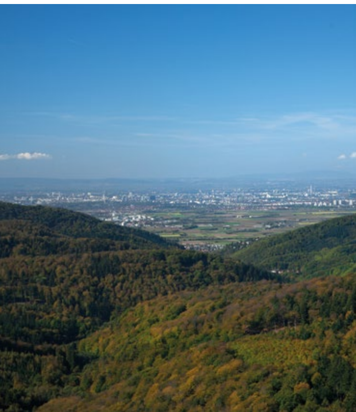
Blick vom „Teltschik-Turm“ bei Wilhelmsfeld.

Wie vielfältig sich die Landschaft des Rhein-Neckar-Kreises zeigt, erschließt sich am ehesten über einen kurzen Blick in die vorherrschenden Naturräume.