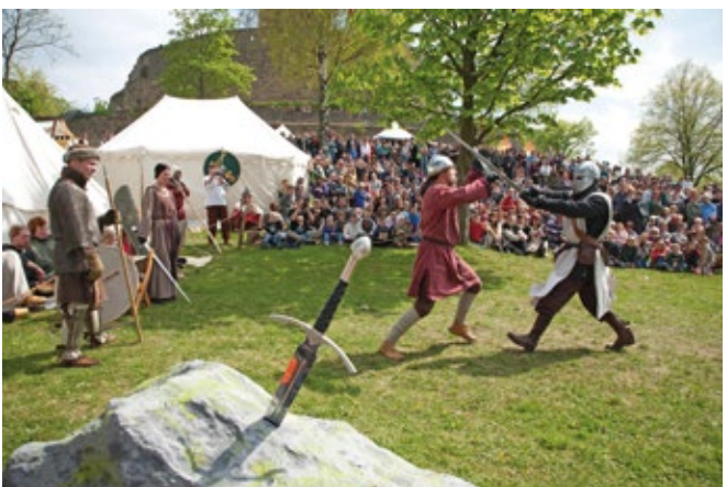
Mittelalterfest auf der Burg Steinsberg in Sinsheim.