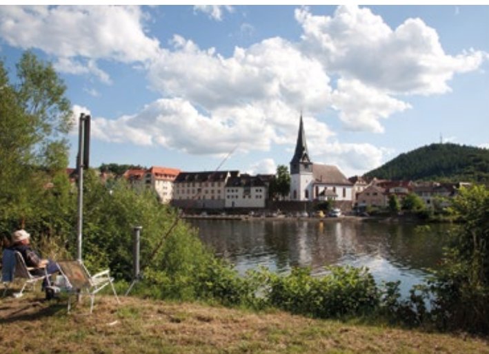
Blick auf die Altstadt von Neckargemünd.

Die ganze Pracht des Neckartals erschließt sich aber erst auf dem Wasser. Schiffsfahrten auf dem Neckar erfreuen sich deshalb im Sommerhalbjahr bei in- und ausländischen Gästen großer Beliebtheit. Infos und Fahrpläne unter www.weisse-flotte-heidelberg.de und www.eps-kappes.de