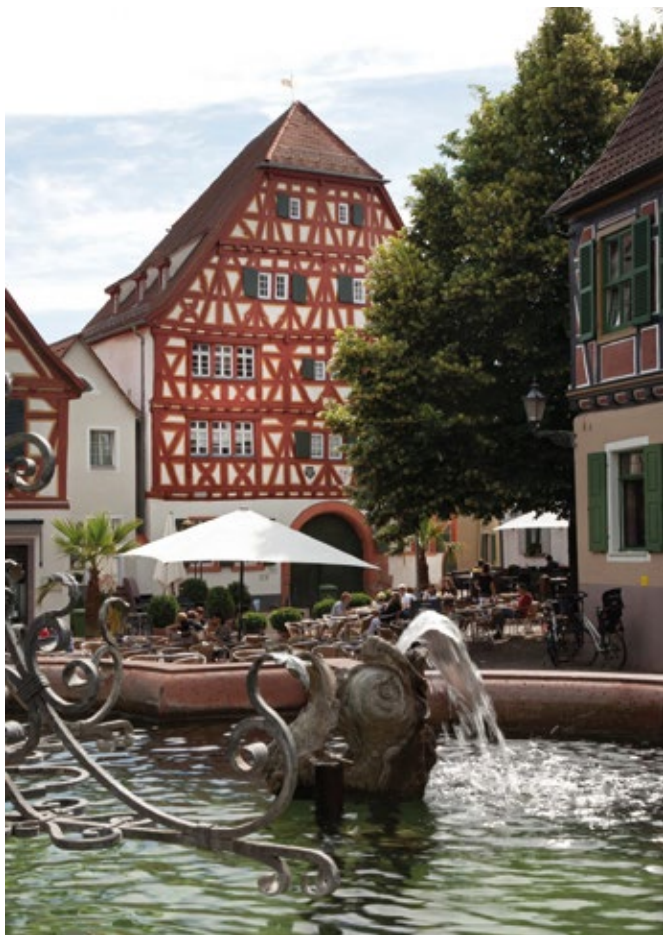
Marktplatz in Ladenburg.

Stadtkern mit seinen restaurierten Fachwerkhäusern aus dem 16. und 17. Jahrhundert hervorzuheben; die ehemalige Sommerresidenz der Wormser Bischöfe beherbergt das Lobden- gäumuseum.