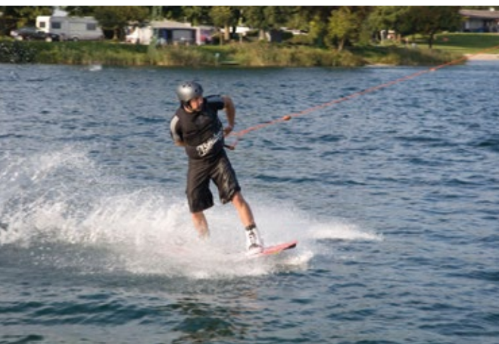
Wasserski- und Wakeboard-Vergnügen auf dem St. Leoner See.

Kanufahrten sind auf den Rheinseitenarmen bei Ketsch und auf dem Neckar bei Eberbach möglich. Die Bundeswasserstraße mit ihrem überschaubaren Schiffsverkehr ist das gesamte Jahr über uneingeschränkt befahrbar. Infos: www.kanu-bike.de