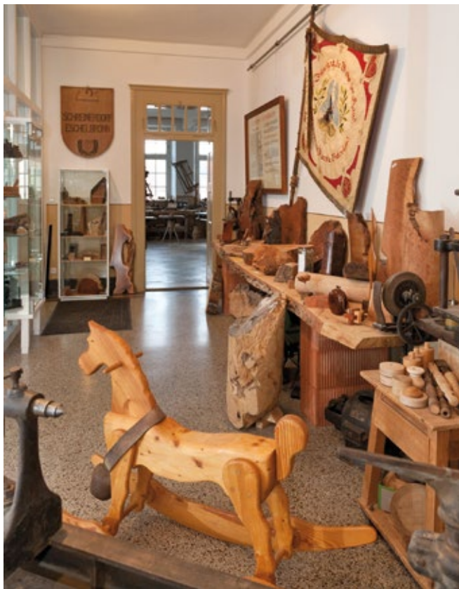
Das Schreinermuseum in Eschelbronn.

Die Region Rhein-Neckar gilt als Wiege der Erfindung der menschlichen Mobilität. Deshalb kommen im Rhein-Neckar-Kreis besonders Automobil- und