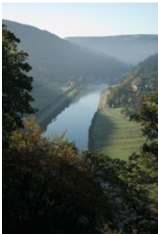
Herrliche Aussichten: Hier der Blick auf den Neckar von der Teufelskanzel bei Eberbach.

In Eppelheim und Wiesloch befinden sich Eissporthallen ; im Sportzentrum Heddesheim steht im Winter sogar eine Eisbahn im Freien zur Verfügung. Besonders Eiszauber vor romantischer Kulisse gibt es auf dem Heidelberger Karlsplatz. Hier kann man je nach Witterung von Mitte November bis Anfang Januar auf der Eisbahn am Fuße des Schlosses seine Runden drehen. Auch in Weinheim ist im Winter romantisches Schlittschuhlaufen unter freiem Himmel möglich.