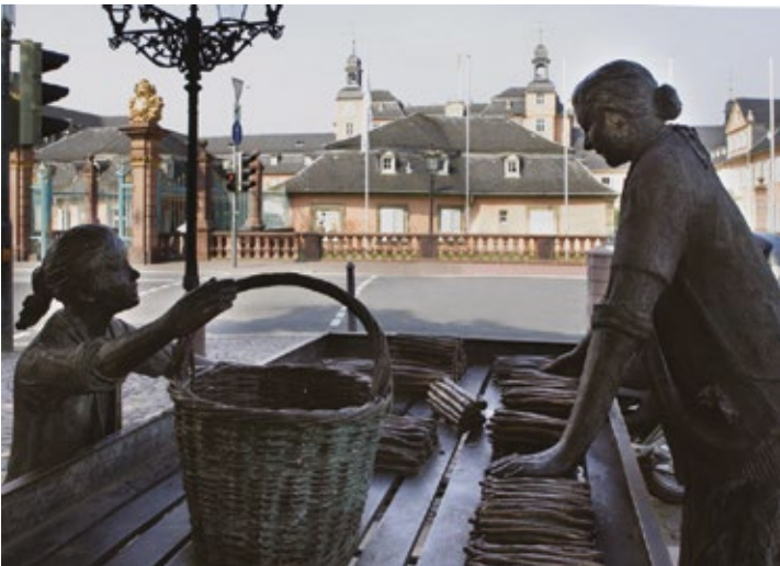
Die „Spargelfrau“ aus Bronze auf dem Schwetzinger Schlossplatz.

Ein weiteres touristisches „Highlight“ stellt Ladenburg dar, das bereits 98 n. Chr. der römische Kaiser Trajan zum Handels- und