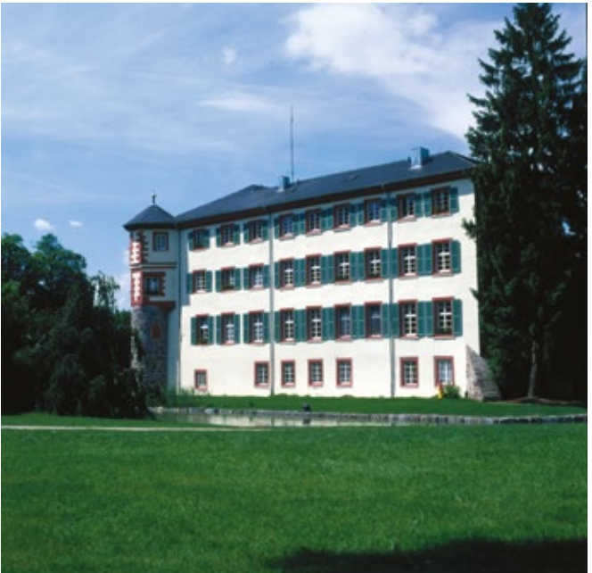
Im romantischen Schlosspark von Angelbachtal-Eichtersheim findet auch die vom Rhein-Neckar-Kreis veranstaltete „Schlosspark-Serenade“ statt.

Ilvesheimer Schloss (seit 1700, heute Blindenschule)