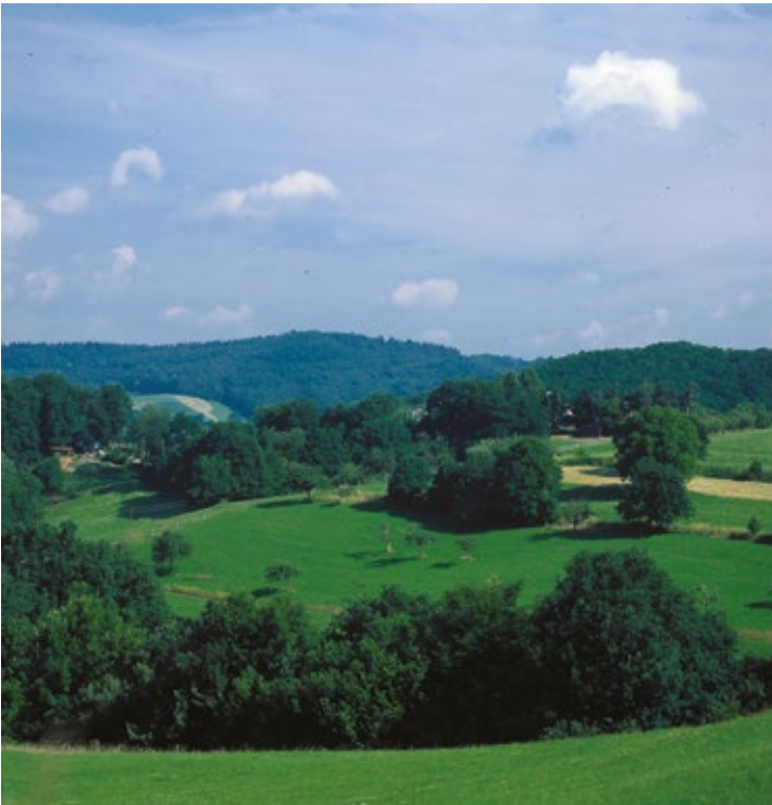
Für Naturliebhaber: Der Kleine Odenwald.

So suchen die Gäste im Fremdenverkehrsort Schönbrunn mit seinen Ortsteilen Allemühl, Haag, Moosbrunn und Schwanheim eher die ruhige Erholung. Neben ausgedehnten Wanderungen sorgt für die sportliche Betätigung ein Reithof mit Reithalle, in den Wintermonaten in den höher gelegenen Bereichen gespurte Langlaufloipen und im Sommer das beheizte Freischwimmbad in Reichartshausen.