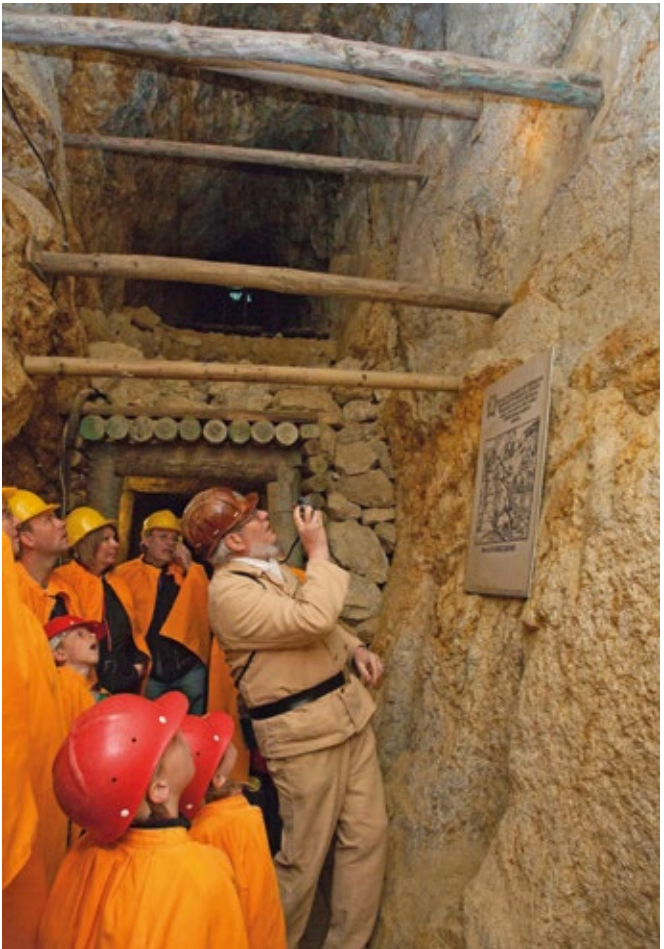
Spannende Eindrücke unter Tage: Das Besucherbergwerk „Grube Anna Elisabeth“ in Schriesheim.

Malsch, Rauenberg, Reilingen und Walldorf bestaunt werden. Für besondere Naturerlebnisse sorgen das Besucherzentrum des Naturparks Neckartal-Odenwald in Eberbach oder die Wald- und Dünenlehrpfade im Waldschutz-