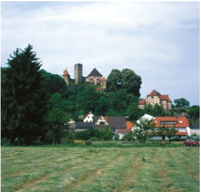
Die Burg Neidenstein ist zum Teil noch bewohnt.

Burg und Schloss Wersau (Ausgrabungsstätte)