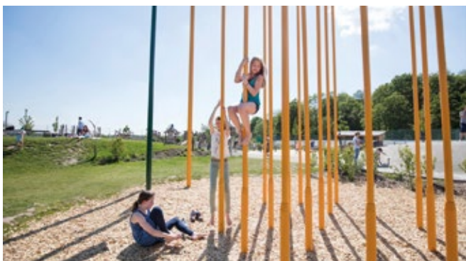
Spiel und Spaß auf der „Alla-hopp-Anlage“ in Schwetzingen

Ausflugstipps für einen schönen Tag mit Kindern finden Sie unter www.deinefreizeit.com/ein-schoener-tag