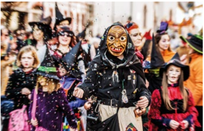
Närrisches Treiben beim Fastnachtsumzug in Hockenheim.

Eine Übersicht traditioneller Feste, Märkte und Events finden Sie in unserem Freizeitportal www.deinefreizeit.com