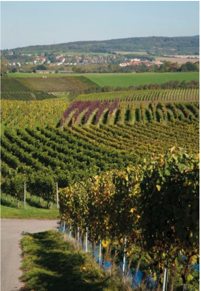
Schöne Aussichten: Blick auf die Rebhänge bei Rauenberg.

Die nur saisonal geöffneten Strauß- und Besenwirtschaften