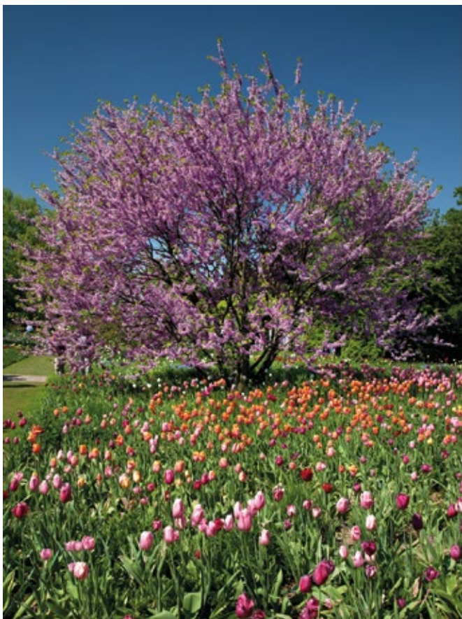
Blütenpracht im Schau- und Sichtungsgarten „Hermannshof“ in Weinheim.

reiches Bild. Aber nicht nur Weinheim mit seinem malerischen Schlosspark und dem einzigartigen Exotenwald, auch die Bergstraßen-Gemeinden Hirschberg und Dossenheim, die Weinorte Schriesheim, Leimen und Wiesloch sind einen Besuch wert.