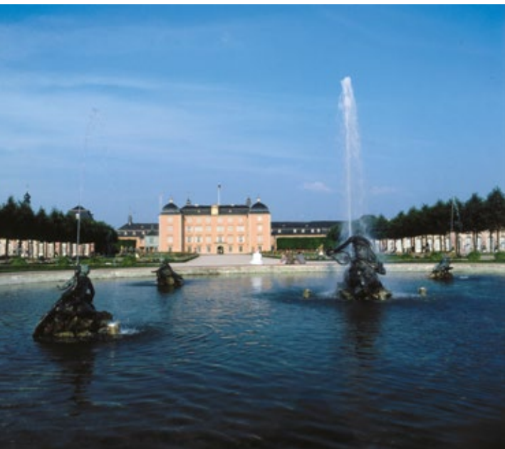
Das Schwetzingen Schloss mit seinem prächtigen Garten.

Wachenburg, Burgruine Windeck, Schloss Weinheim (heute Rathaus)