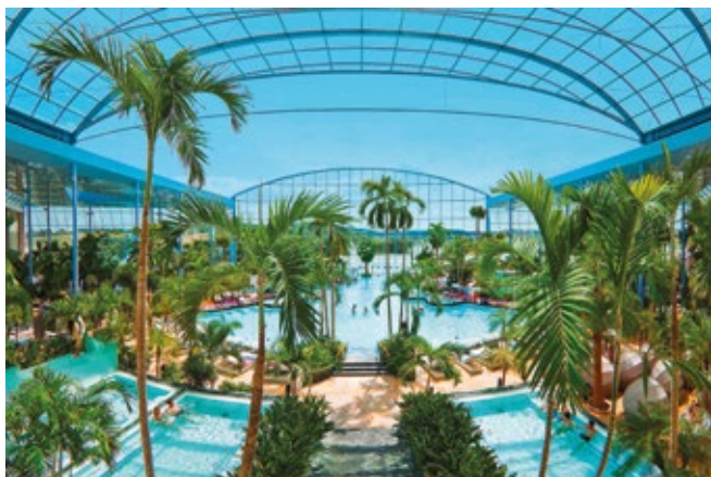
Urlaubsfeeling in der Thermen- und Badewelt Sinsheim.