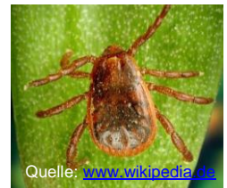
braune Hundezecke