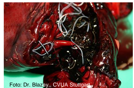
Hundeherz mit Herzwürmern

Für weitere Fragen zu rechtlichen Bestimmungen, Reisekrankheiten und zur Reiseapotheke für Ihr Haustier stehen Ihnen die praktizierenden Tierärzte, die Veterinärämter und die Labortierärzte zur Verfügung.