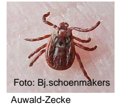
Auwald-Zecke